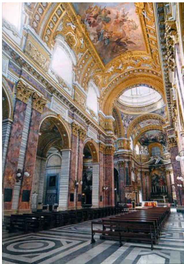
Interno della Basilica: Navata centrale

Nella volta a botte, San Carlo in gloria , affresco di Giacinto Brandi, terminato nel 1677. Il dipinto simula un arazzo i cui lembi sono sorretti da quattro figure in stucco, attribuite a Girolamo Gramignoli, romano.