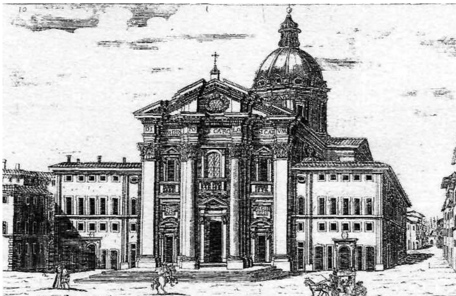
Antica stampa della fine del XVIII secolo con la Basilica e sulla destra Via Schiavonia

La Basilica, quale appare oggi, risale al 1610, anno della Canonizzazione di Carlo Borromeo. Il titolo definitivo di "Chiesa del SS. Ambrogio e Carlo" fu concesso all'Arciconfraternita da Paolo V (1605-1621), nel 1612. Urbano VIII (1623-1644), poi, estese privilegi, grazie ed indulgenze al nuovo tempio nel 1627 mentre l'oratorio di S. Ambrogio veniva riservato all'Arciconfraternita, per le attività religiose.