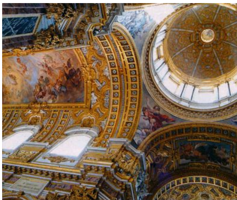
Navata centrale cupola

Nello stesso periodo in cui si svolgeva il concorso per la realizzazione della facciata, Pietro da Cortona effettuò la verifica dei piloni e progettò la cupola (alt. m. 70, dm. m. 14), realizzata tra il 1668 e il 1669. Maestosa apparve la visione dal basso, tra le più imponenti di Roma. Viene definita da Cesare Brandi nel suo Disegno dell'Architettura Italiana : «... opera straordinaria del Cortona, ... la più nuova, con quella di Sant'Ivo alla Sapienza del Borromini, dopo quella di S. Pietro».