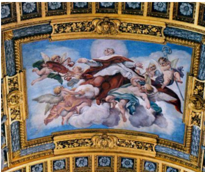
Tribuna: S. Carlo in Gloria , di Giacinto Brandi

Tra il 1677 e la fine del 1680 Paolo Brozzi eseguì i dipinti monocromi, "pitture di chiaro oscuro con oro" che, ancora oggi, costituiscono una decorazione unitaria delle navate e del deambulatorio. Nella volta di ogni campata si trova una cornice quadrilobata, con quattro peducci e una scena simbolica. Questi affreschi, compiuti da pittori diversi ma della stessa