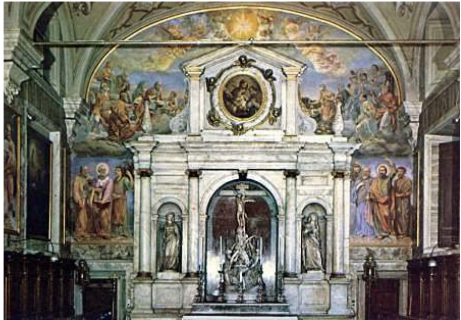
Oratorio di S. Ambrogio

Soffitto: al centro L'incoronazione della Vergine, i Santi Ambrogio e Carlo, e Pio XI ; ai lati la Natività e la Risurrezione .