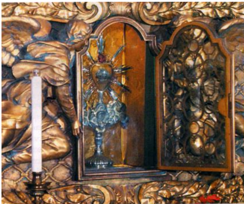
La reliquia del Cuore di S. Carlo

Sopra l'altare: S. Carlo in adorazione della Vergine col Bambino (Stendardo dell'Arciconfraternita, di scuola marattesca).