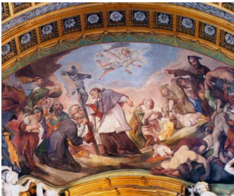
Tribuna: S. Carlo reca la croce tra gli ammalati di peste, di Giacinto Brandi

Parete destra: monumento funebre di Bernardino Jacopucci che aveva fatto restaurare la cappella per la sua sepoltura (sec. XIX).