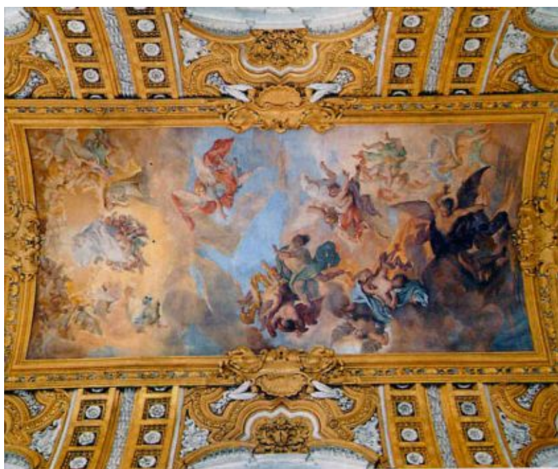
Volta della Navata centrale: affresco Caduta degli Angeli ribelli , di Giacinto Brandi

Nel catino dell'abside, San Carlo reca la croce tra i malati di peste , affresco di Giacinto Brandi, realizzato nel 1677. Insieme ai Santi in gloria , nei due bracci del transetto. Dei fratelli Fancelli, Cosimo (1620-1688) e Jacopo Antonio (1619-1672), sono gli stucchi raffiguranti Angeli musicanti .